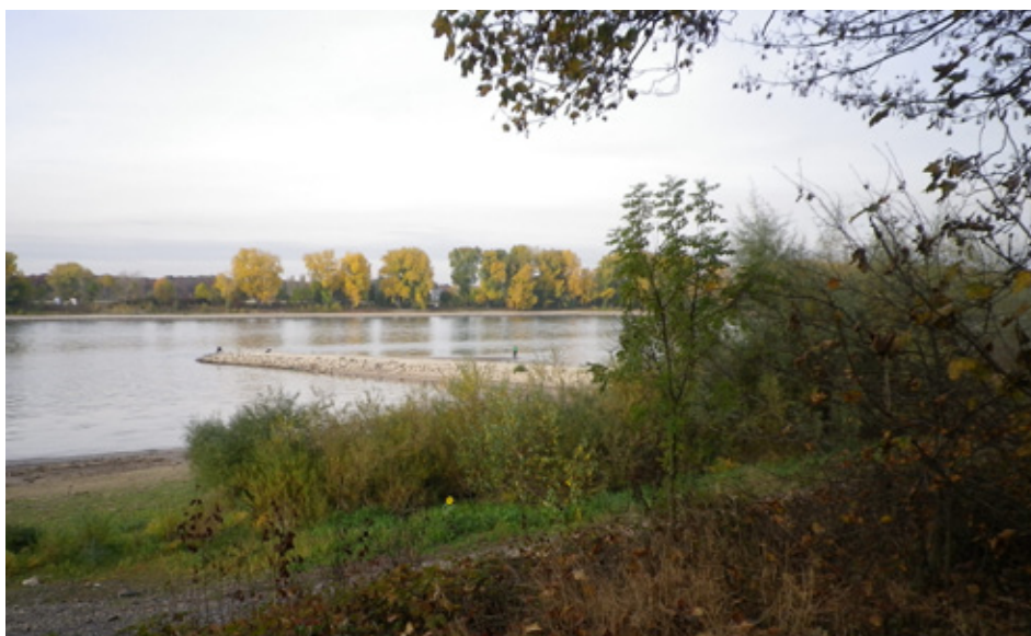
4: Blick auf das Rheinufer und die FFH-Fischschutzzone auf Höhe des Naturschutzgebietes Langel Auwald.

Ungerichtete Einzelkompensationen und letztendlich nicht funktionierende CEF-Maßnahmen aus dem Artenschutzrecht tragen dauerhaft die rechtlichen Anforderungen nicht und gefährden rückwirkend die Zulassung bereits baulich umgesetzter Bauvorhaben. Die bisher vorherrschende Strategie, Artenschutz politisch abzuwerten und als Planungshindernis darzustellen führt genau in den Konflikt fehlender zukünftiger Handlungsspielräume hinein. Eine offensive Entwicklung einer naturschutzfachlich schlüssigen Schutzkulisse und ein hohes Engagement zur Verbesserung der Populationen bedrohter Arten würde dagegen erhebliche planerische Spielräume erschließen. Das wird bisher jedoch oft nicht verstanden.