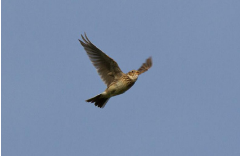
5: Landesweit im Sinkflug: Die Feldlerche hat im Eingriffsgebiet noch nennenswerte Bestände, die kaum zu kompensieren sind.