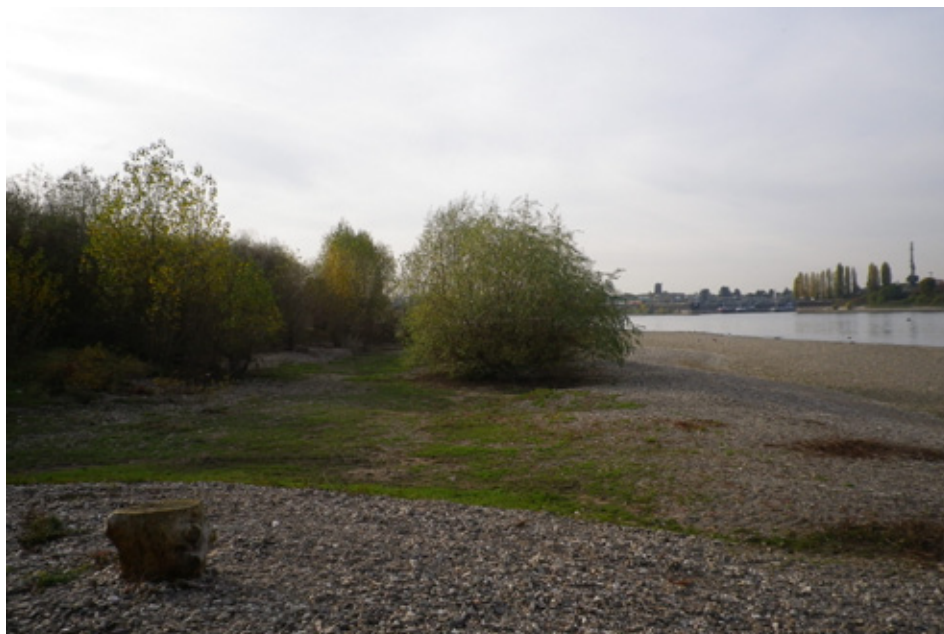
1: Eine der für den Hochwasserschutz wichtigen Retentionsflächen am Rhein.

Hinzu kommen zusätzlich zahlreiche öffentliche und planungsrelevante Belange (z. B. Schutz der Anwohner und landwirtschaftlichen Betriebe, Hochwasserschutz, Biotopverbund, Klimaschutz, Trinkwasserschutz, Bodenschutz), die dem Vorhaben entgegenstehen oder so erheblich beeinträchtigt würden, dass auch bei Würdigung der einer Abwägung zugänglichen Aspekte die Realisierung einer gänzlich neuen Ost-West-Querspange völlig unverhältnismäßig ist und nicht in Frage kommt.