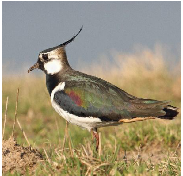
3: Die lokale Population des Kiebitzes ist von den geplanten Baumaßnahmen erheblich betroffen.

Der Lebensraumkomplex der Spicher Seen hat eine hohe Bedeutung und ein hohes weiteres Entwicklungspotential u. a. für Amphibien, Vögel und Wasservögel. Im behördenverbindlichen Regionalplan ist das Gebiet zu großen Teilen als Bereich für den Schutz der Natur dargestellt (BSN SU-37), es soll also als Naturschutzgebiet (NSG) gesichert werden. Als Rückzugsraum seltener Arten (z. B. Weihe, Schwarzer Milan) für die übermäßig als Erholungsgebiet genutzten FFH- und Naturschutzgebiete der Sieg wird es ebenso benötigt wie als Lebensraum typischer Amphibien der Auenlandschaften der großen Ströme, insbesondere die Arten Wechselkröte und Kreuzkröte. Fledermäuse nutzen das Gebiet intensiv.