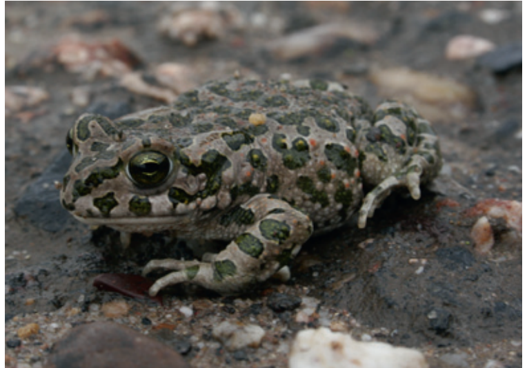
7: Die Wechselkröte ist eine der vom Bauvorhaben bedrohten Arten.